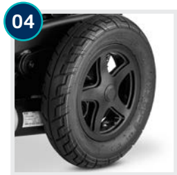
04 CODE 460