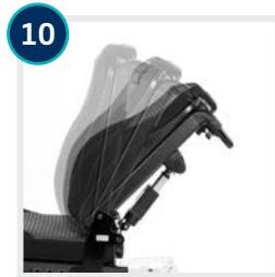
10 CODE 25