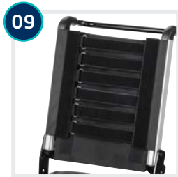
09 CODE 736/287